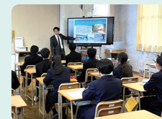
佐賀市立小中一貫校 松梅校 中学部での出前授業

みんなの生活に深く関わる土木の仕事をもっと知ってもらうため、出前授業も行っています。佐賀の土木事業や防災の課題などについて話します。