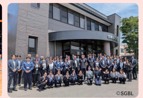
佐賀バルナーズが来社(2026.5)